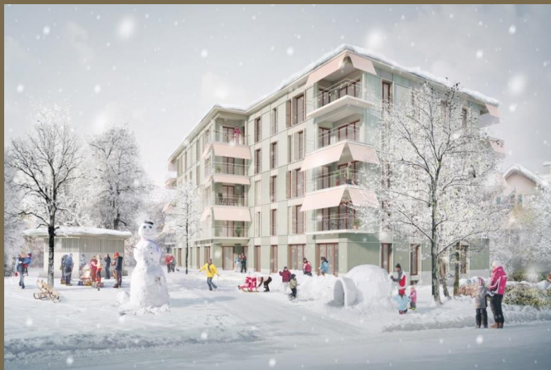
Visualisierung: ARGE graberschuess / Gauch & Schwartz, Architekten ETH SIA, Zug