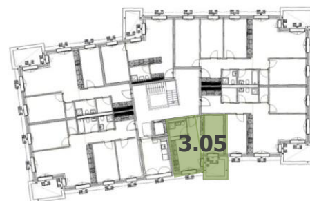
Übersicht 3. Stock